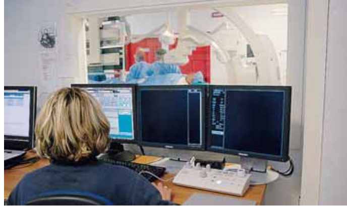
Medici al lavoro con la nuova apparecchiatura donata dalla Fondazione